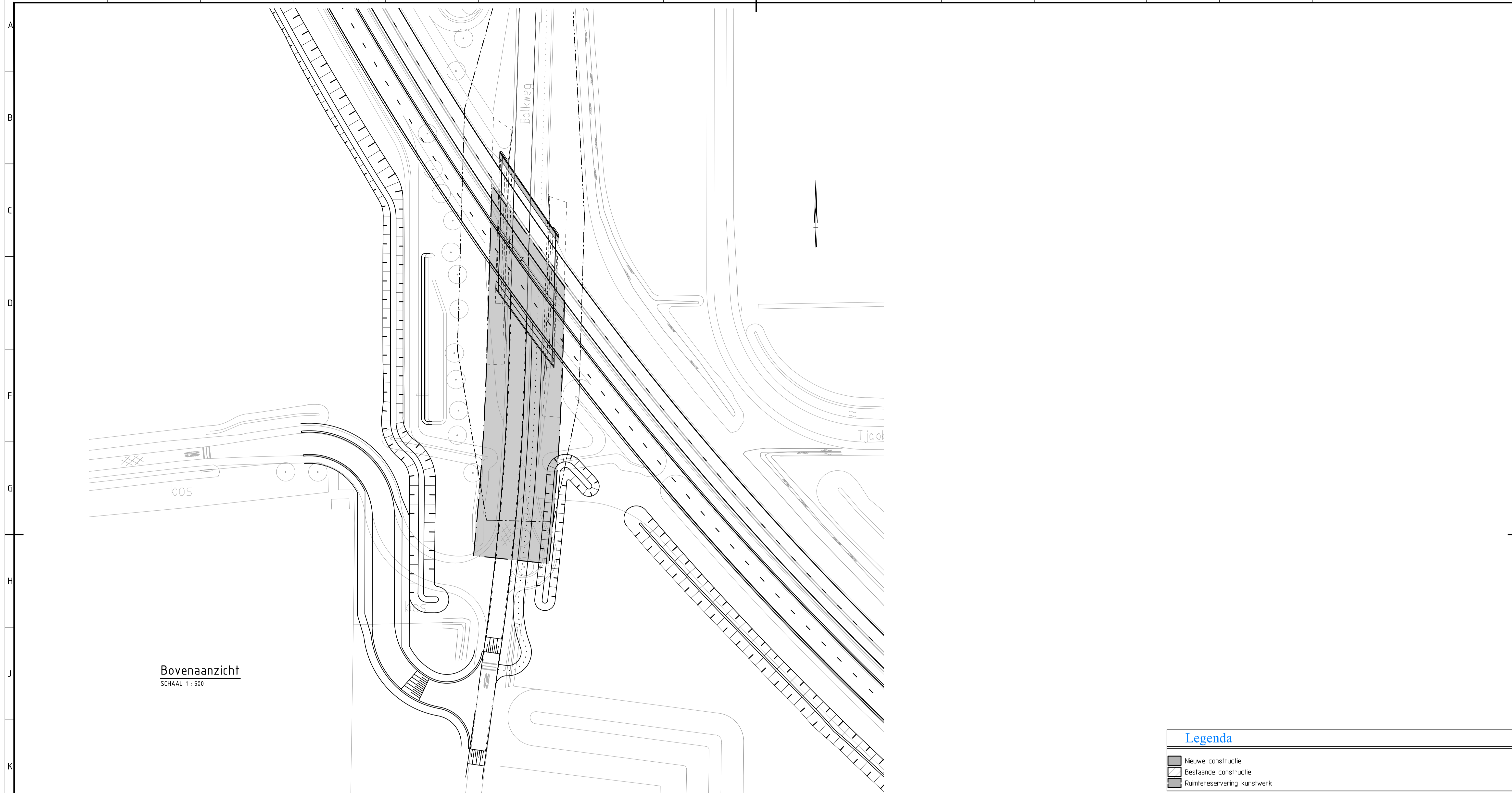
Bovenaanzicht SCHAAL 1 : 500