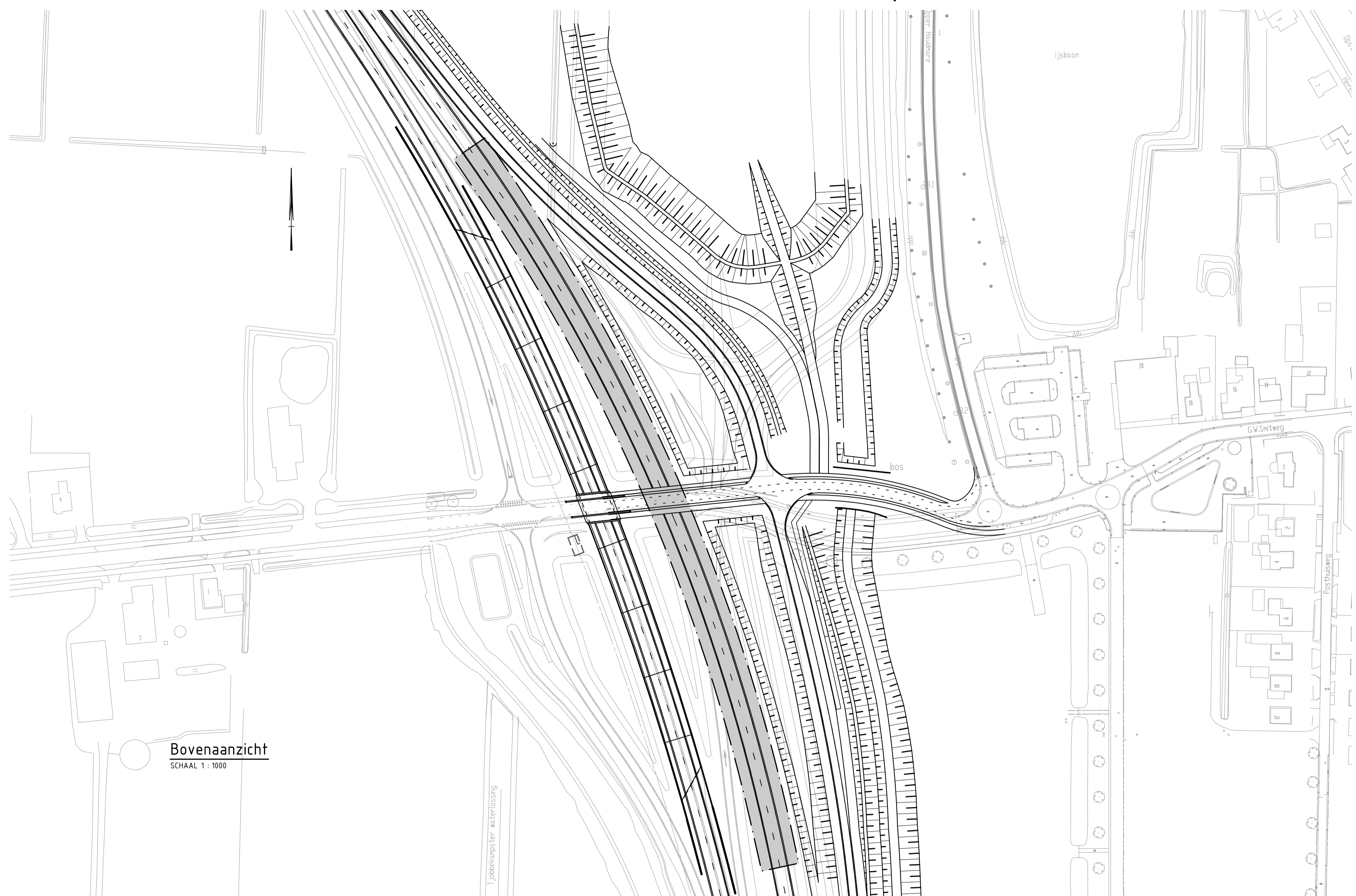
Bovenaanzicht SCHAAL 1 : 1000