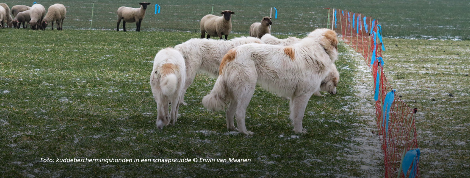
Foto: kuddebeschermingshonden in een schaapskudde