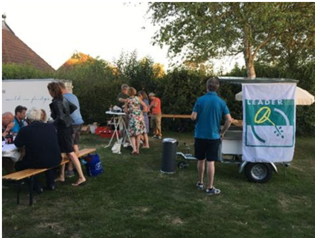
Werkbezoek Denen en leren aan Noordoost

In het kader van internationale samenwerking heeft als vervolg op een bezoek naar Denemarken een tegenbezoek vanuit Denemarken plaatsgevonden. Een delegatie uit Ierland heeft hier ook aan deelgenomen. De uitwisseling is opgezet samen met LEADER Noordwest Fryslân. Ook hiermee vindt een intensive kennisuitwisseling plaats. Als vervolg en ter voorbereiding op een concreet samenwerkingsproject met partners in de Aarhusregio, heeft een kleine afvaardiging van Streekplatform, een initiatiefnemer, iemand van Doarp en Bedriuw Fryslân en het projectbureau in oktober 2018 een bezoek gebracht aan de partners in Denemarken. Het bezoek was vooral gericht op kennisdeling en inspiratie. De kenniswisseling heeft nog niet geleid tot een internationaal samenwerkingsproject. Samen met buur LEADER gebied Noordwest Fryslân vindt er nog een oriëntatie plaats met Ierse partners.