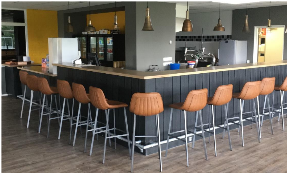
Sbso huiskamer van sportend Trynwâlden